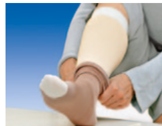
Enkel att ta på.

Strumporna ska inte vridas ur, inte centrifugeras eller torkas i torktumlare. Pressa ur vattnet mellan två torra handdukar och lufttorka strumporna. Strumporna tar skada av direkt hetta t.ex. värmeelement och direkt sol-ljus, liksom strykning eller rengöring med bensin eller kemikalier.